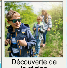
Découverte de la région

La participation financière du séjour par enfant est donc de 180 € Ce séjour est limité à 40 enfants.