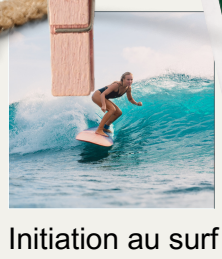
Initiation au surf