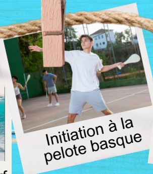
Initiation à la pelote basque