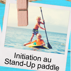
Initiation au Stand-Up paddle